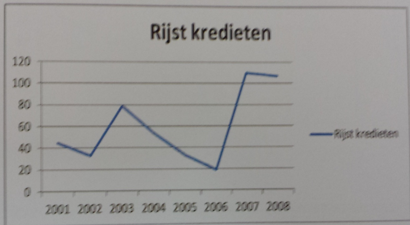
Figuur 5a: Rijstkredieten